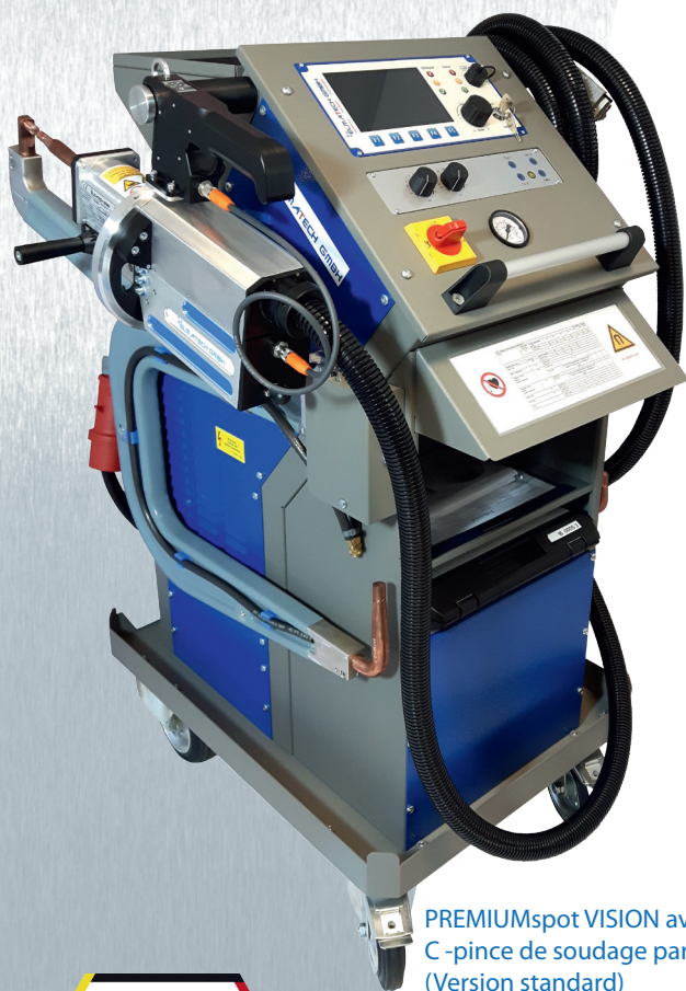
PREMIUMspot VISION avec C-pince de soudage par points (Version standard)

Réglage automatique de l'apport d'énergie Reconnaissance automatique de l'épaisseur de la tôle Reconnaissance automatique du matériau Reconnaissance automatique de shunt Alimentation continue en énergie automatique